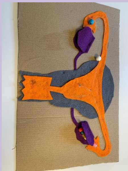
Modell 1 - utan urinblåsa