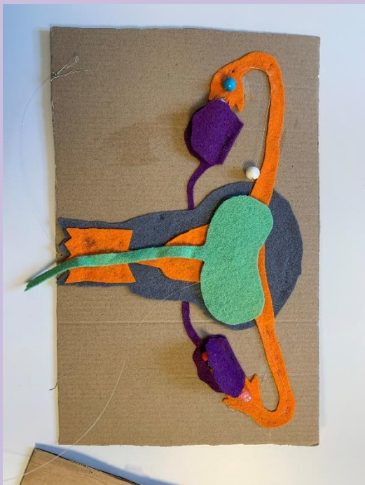
Modell 1 med urinblåsans placering