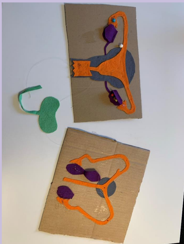
BÅDA MODELLER med urinblåsan emellan